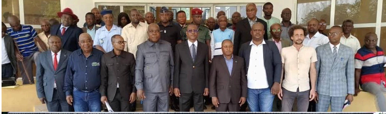
Haut: Atelier départemental de validation du plan d'aménagement de la RCLT, Impfondo (12 décembre 2025). Autorités locales, départementales et représentants de la RCLT.